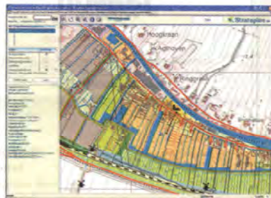
De LocatiePlanner bekijkt online kadastrale informatie en kaarten waaraan allerlei informatie is gekoppeld. De gebruiker kan gebiedsgericht zoeken naar onder meer grondposities, luchtkwaliteit, zoneringen.

Het inzicht in perceelsgrenzen en perceeleigenaar en de registratie van eigendomsrechten en belemmeringen helpen de gebiedsontwikkelaar niet een strategisch grondbeleid te voeren. Ontwikkelaars hebben behoefte aan een actueel overzicht van grondposities van collega's en overheden in een beoogd gebied en van grondprijzen. Woningcorporaties hebben er belang bij snel te weten waar ze grond van projectontwikkelaars kunnen overnemen die vanwege de recessie of om andere redenen niet binnen enkele jaren commercieel ontwikkeld worden. Zo zijn meer argumenten te bedenken voor het Kadaster om het infor-